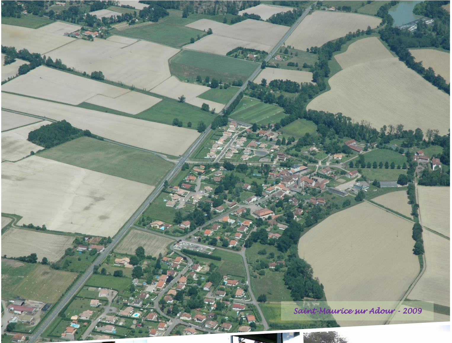
Saint-Maurice sur Adour - 2009