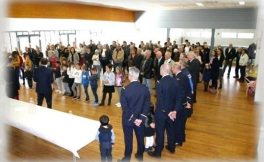
Cette commémoration s'est terminée autour d'une réception conviviale.