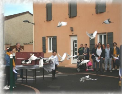
Un lâcher de colombes et de pigeons clôtura cette belle cérémonie.