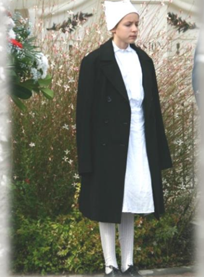
Une infirmière en tenue d'époque.