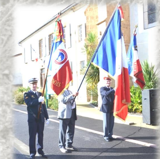
De gauche à droite, le drapeau du Souvenir Français cantonal, le drapeau de la commune, le drapeau de l'Union Nationale des Parachutistes.