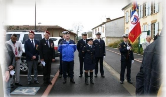
Les autorités civiles et militaires s'étaient jointes aux nombreux Saint-Mauricois...