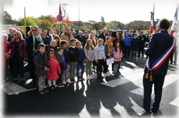
Avec la participation des enfants de l'école du village.