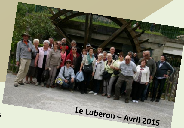
Le Luberon – Avril 2015

Chers Amis, Saint-Mauriçoises et Saint-Mauriçois, vous serez les bienvenus dans notre association.