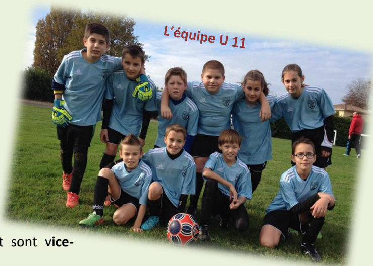
L'équipe U 11

Nous faisons donc appel à toutes les bonnes volontés qui voudraient donner un peu de leur temps au football de venir nous rejoindre, le meilleur accueil leur sera réservé.