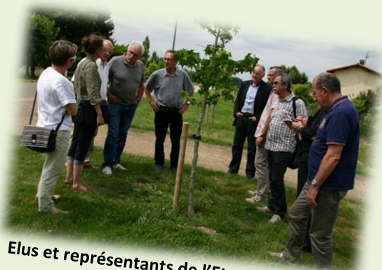
Elus et représentants de l'Etat sur le terrain

Affaire à suivre... En attendant, préparons nos mollets pour une liaison future Grenade – Saint-Maurice !